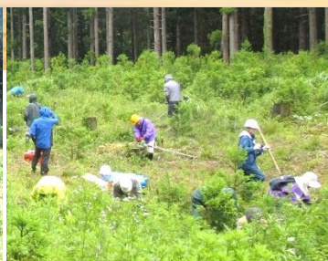
例年の根刈りの様子