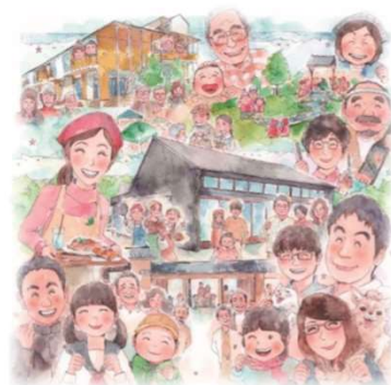
駅北大火3年事業イメージイラスト