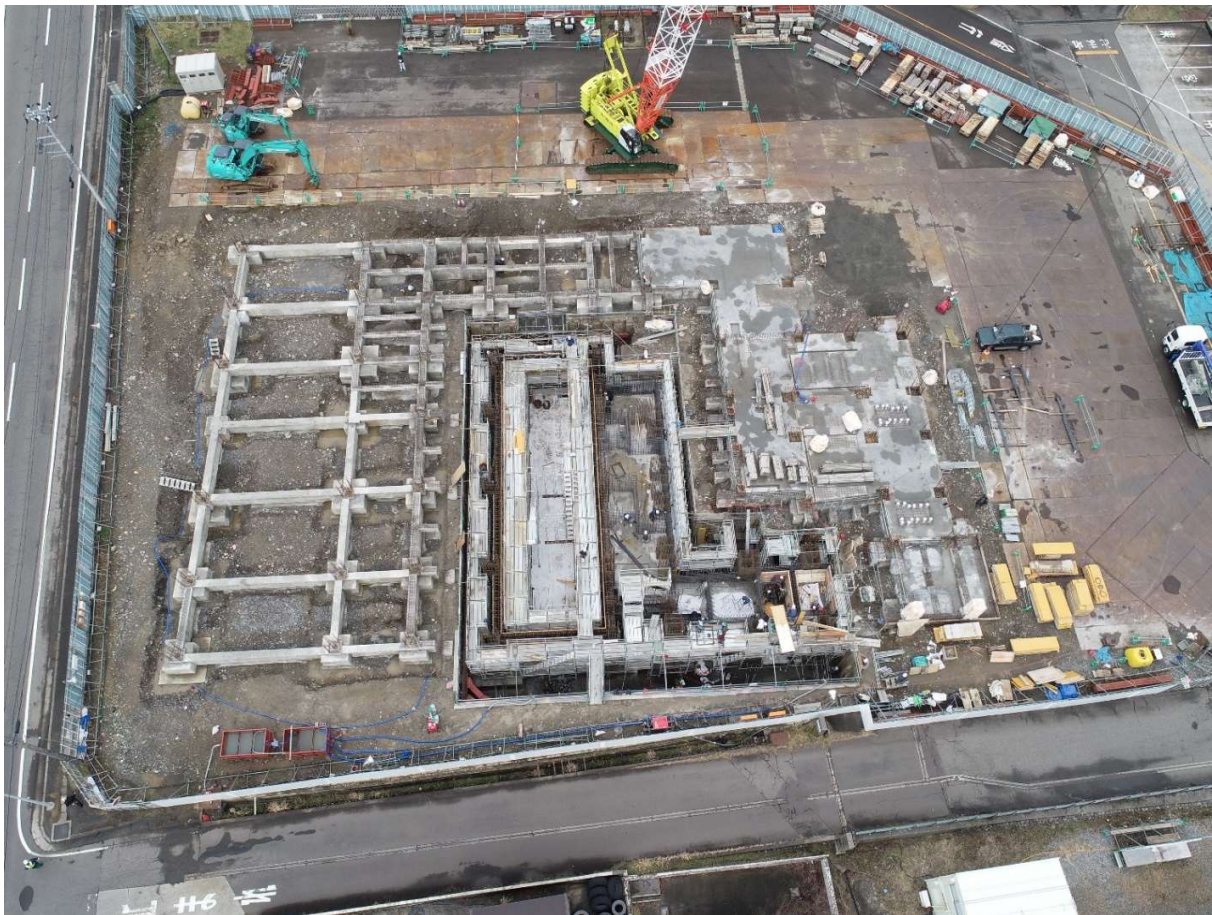
ピット部分の壁配筋中