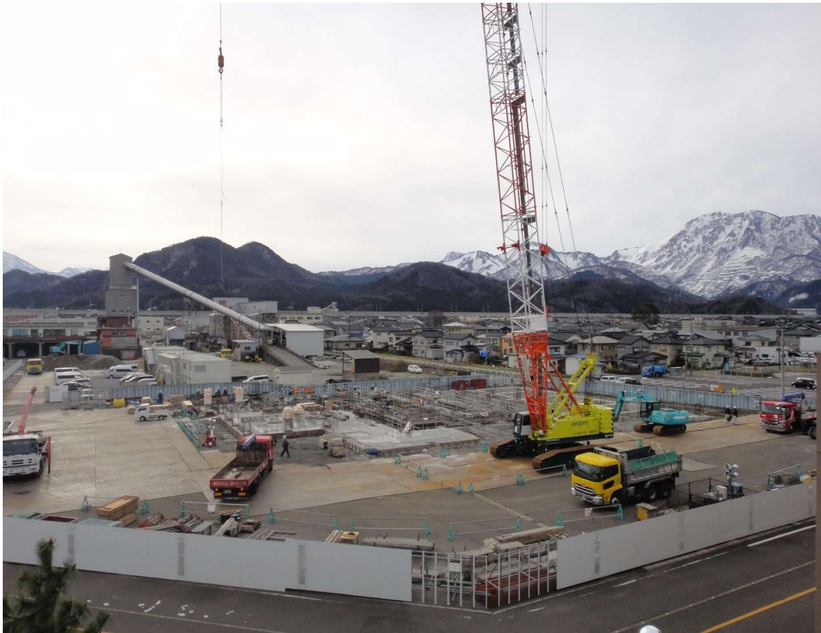
ピット部分の壁配筋中