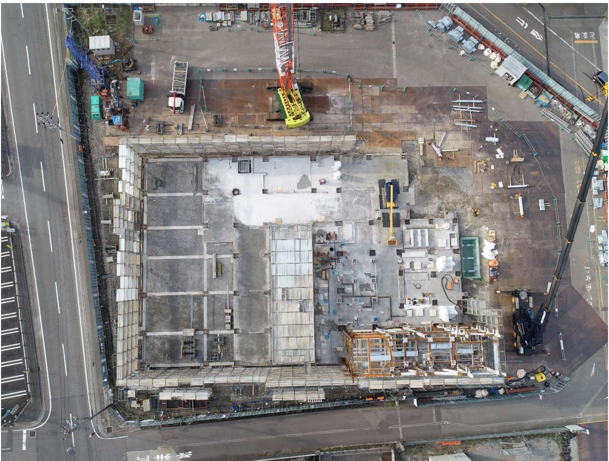
炉室部分の鉄骨組立中