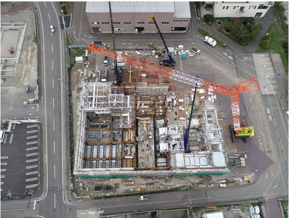
居室部分の鉄骨組立中