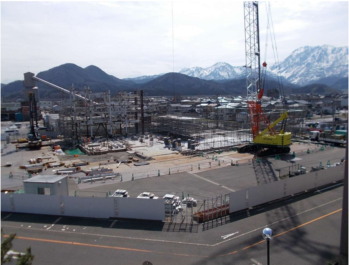
炉室部分の鉄骨組立中