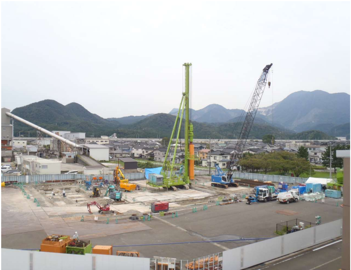
ピット部分の山留工事中