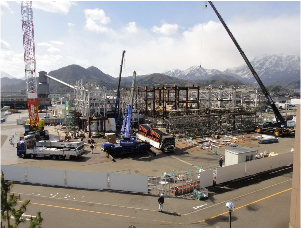
燃焼装置の搬入中