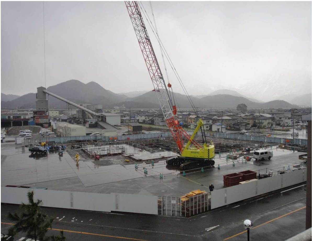
ピット部分の基礎配筋中