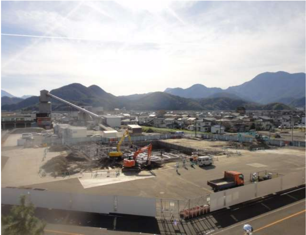
ピット部分の掘削完了