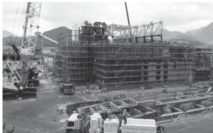
建設中の次期ごみ処理施設

条例の制定1件、補正予算1件、陳情1件を審査しました。また、「健康づくりセンタープールの整備について」「次期ごみ処理施設の整備について」「地域包括ケアシステムについて」の所管事項調査を行っています。