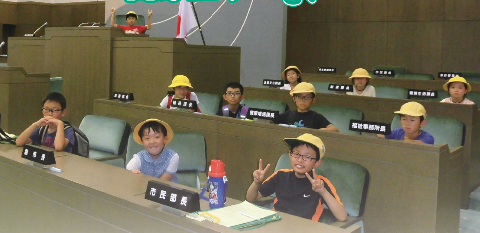
南能生小学校3・4年生議場見学(7月1日)