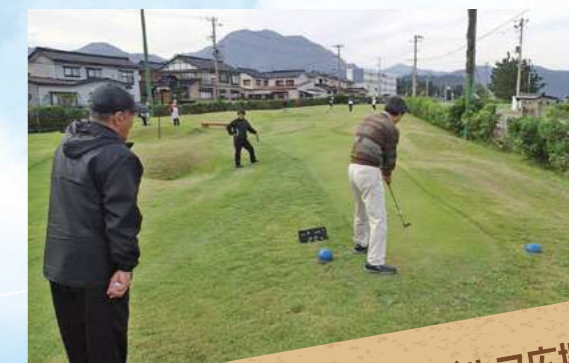
D パターゴルフ広場

18ホールのコースがあるパターゴルフ場です。初心者の方でも気軽にゴルフが楽しめます。お子さまからご年配の方までご利用いただけますので休日にみんなでゴルフなんていかがでしょうか。