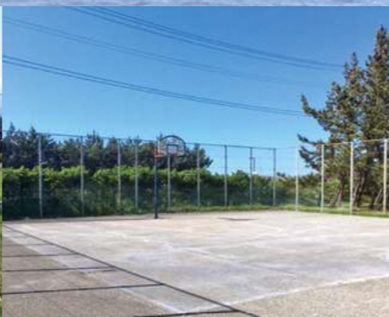
バスケットボールコート