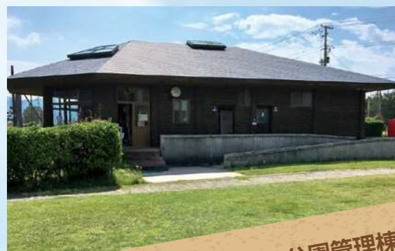
A 須沢臨海公園管理棟