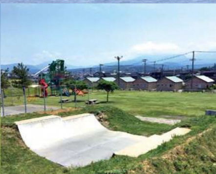
スケートボード・ハーフパイプ