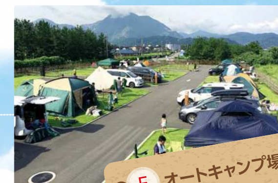
E オートキャンプ場

18ホールのコースがあるパターゴルフ場です。初心者の方でも気軽にゴルフが楽しめます。お子さまからご年配の方までご利用いただけますので休日にみんなでゴルフなんていかがでしょうか。