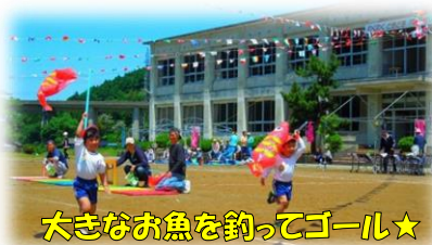
大きなお魚を釣ってゴール★