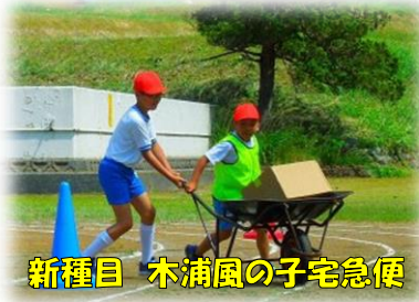
新種目 木浦風の子宅急便