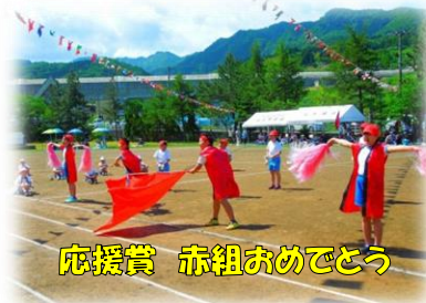
応援賞 赤組おめでとう