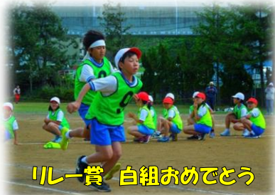
リレー賞 白組おめでとう