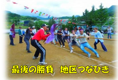
最後の勝負 地区つなひき