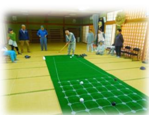
囲碁ボール体験会

9月以降も、一つひとつの活動を見直しながら、着実に事業を展開できればと考えています。変わらぬご支援・ご協力よろしくお願いたします。