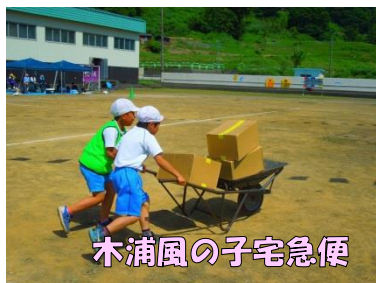
木浦風の子宅急便