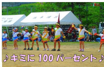
♪キミに100パーセント♪