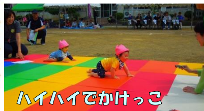
ハイハイでかけっこ

★☆☆☆☆☆☆☆☆☆☆☆☆☆☆☆☆☆☆ 優勝 中尾地区 準優勝 新戸地区 3位 浜木浦地区 ★☆☆☆☆☆☆☆☆☆☆☆☆☆☆☆☆☆☆