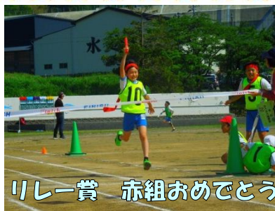
リレー賞 赤組おめでとう