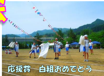
応援賞 白組おめでとう