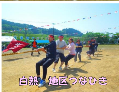
白熱 地区つなひき