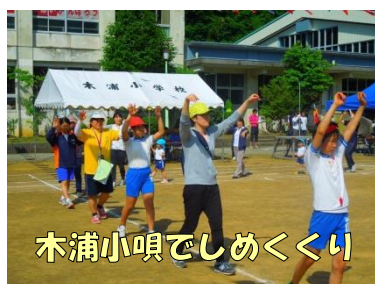
木浦小唄でしめくくり