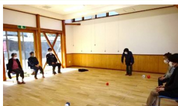
3/8(水) ボッチャの様子