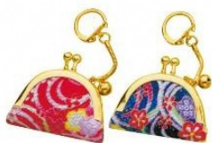
かま口 キーホルダー