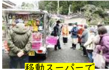
移動スーパーで お買い物体験

青海地域には、スーパーが一軒となり、シニア世代にとっては不便に感じている人も多いのではないのでしょうか。そこで、玄関先まで出向いてくれる移動スーパーの体験会や配達弁当の説明会を企画し、高畑地区と田海地区で同じ内容で2回開催しました。