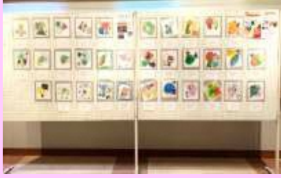
親子で楽しむアート教室 「まる・さんかく・しかく」