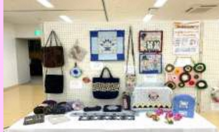
パッチワークサークル

8年目の出展となりました。9月に実施した親子で楽しむアート教室でオイルパステルを使い「まる・さんかく・しかく」を描きました。