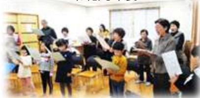
地域の方と、児童クラブの子どもたちが、「青海の歌」を一緒に歌い、交流しました。