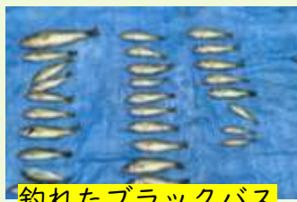
釣れたブラックバス