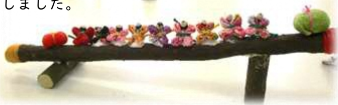
南天九猿は、南天の木に9匹の猿を座らせる事で、9匹の猿が難を持ち去る縁起物の飾り物です

南天九猿は、細かな作業で大変でしたが、小さな「さるぼぼ」がとても可愛らしく、南天の枝にどのように座らせるか楽しみながら作製しました。