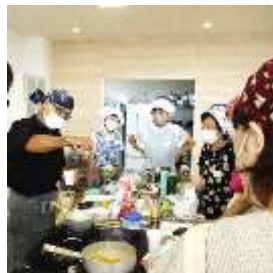
野菜サラダ リコッタチーズのせ