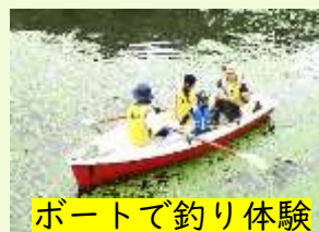
ボートで釣り体験