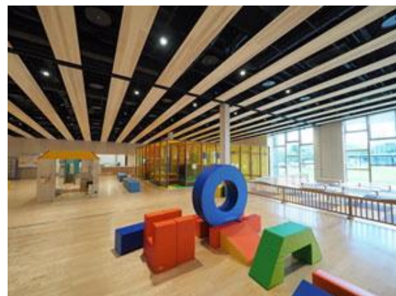
上越市オーレンプラザ プレイエリア(約450㎡)