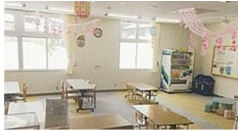
妙高市わくわくランドあらい 交流ラウンジ