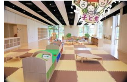
上越市オーレンプラザ プレイルーム(約130㎡)