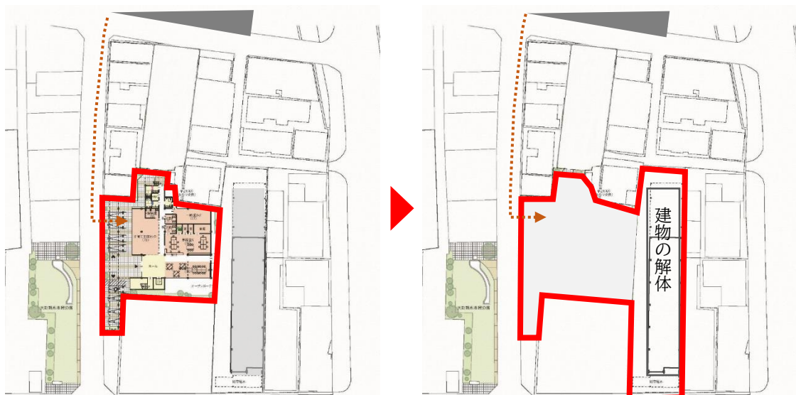
2巡目懇談会時の資料 (敷地面積 861.26 m 2 )