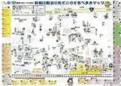
<駅周辺の見どころ・ お食事どころの地図>

◇糸魚川観光案内所（ヒスイ王国館（駅前広場東側）2階）で 「糸魚川駅北の見どころ食べ歩きマップ（下の写真）」などをゲット