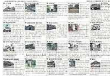
<裏側には見どころの解説>