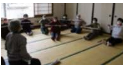
新聞紙を使用する運動