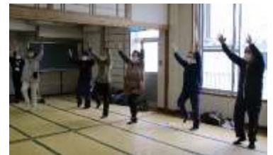
歌いながら「さ」で手を上にあげます

30まで数えながら、3と5の倍数で手をたたいたり、童謡「あんたがたどこさ」を歌いながら、「さ」で手を上にあげたりしました。