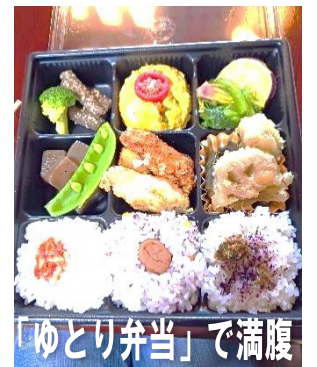
「ゆとり弁当」で満腹