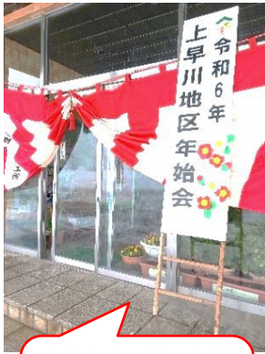
3年ぶりの開催。抽選会で楽しみました。