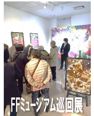
FFミュージアム巡回展

FFミュージアムで糸魚川市を皮切りに始まったばかりの巡回展を見学。今後全国の方に見ていただき、ますます糸魚川のジオサイトに興味を持っていただける内容でした。