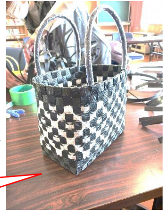
編む度に可愛い花の模様仕上がる ところが魅力的です！

材料は梱包用のバンドなのでとてもしっかりしています。2色のテープの組み方で様々な模様を作ることが出来ます。受講生はバンドを交互に入れる工程に苦労されている様子でしたが段々と形が出来上がってくると達成感も生まれ、完成に向けて作業しました。