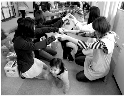
親子でじゃれつき遊び

いては、アンケートの回収率が85.1%と非常に高く、子育てに対する関心の高さがうかがわれ、経済的支援を望む声が多くみられたことが特徴として挙げられる。