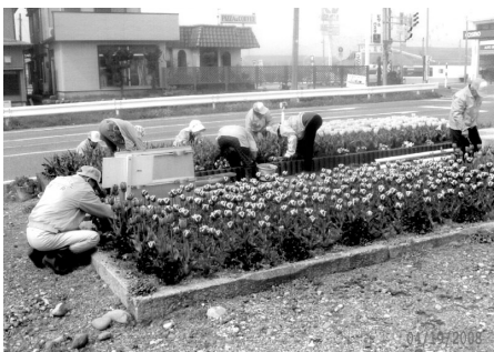
花いっぱい事業でのチューリップの手入れ

宿泊と飲食への対応については、地場産品及び地域料理の活用等により、顧客満足度を上げられるよう関係者に働きかけを行っていく。魅力づくりや戦略について