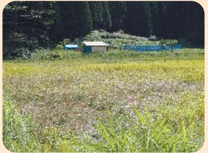
▲イノシシに荒らされた田