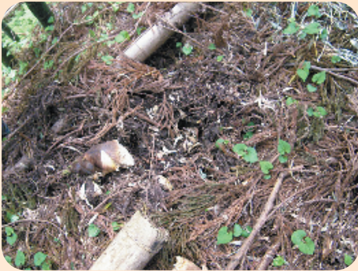
▲イノシシが食い荒らしたタケノコ