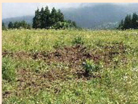
▲イノシシに荒らされた農地