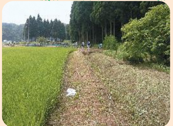
▲山林との間をきれいに刈り払われた田