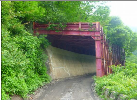
山之坊第1シェッド