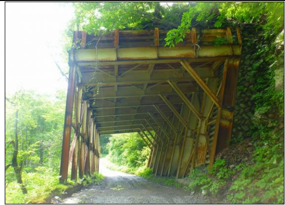
山之坊第2シェッド