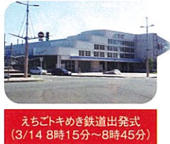
えちごトキめき鉄道出発式 (3/14 8時15分~8時45分)