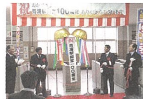
▲青海駅開業100周年記念式典

特に、現在の青海駅舎は1968年(昭和43年)に供用開始しましたが、橋上駅舎や駅の南北をつなぐ自由通路を有する、当時としては非常に珍しい駅でした。