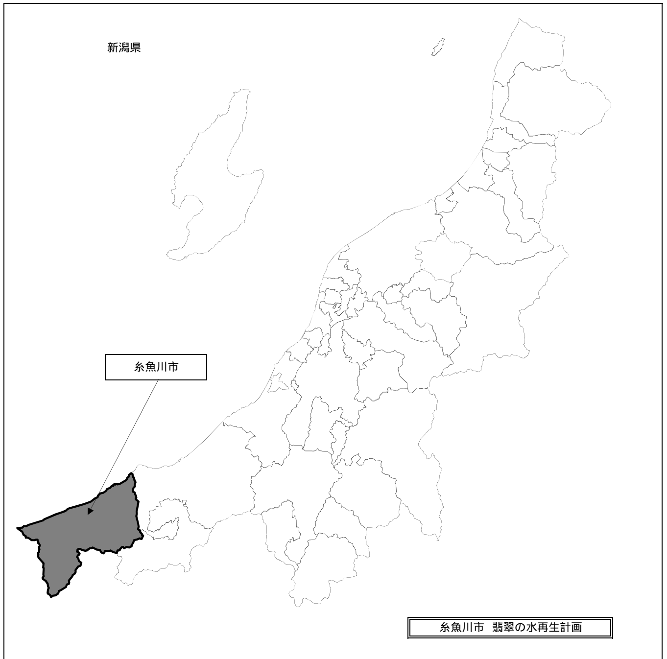
資料1 地域再生計画の区域に含まれる行政区画を表示した図面