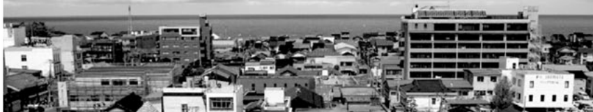
駅ホームから日本海を一望(イメージ)

※インターネットの地図サービスにより、各駅の出口から海までのおよその最短距離を糸魚川市が独自に計測