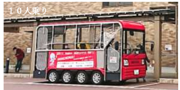
R2.10 糸魚川駅開業5周年記念イベント