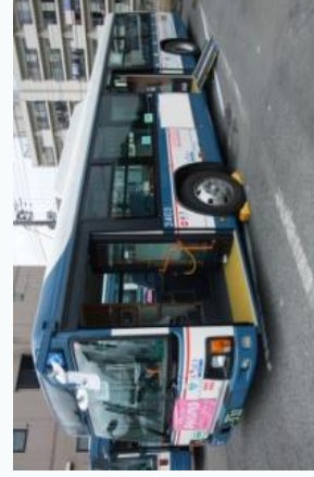
ノンステップバス

補助率：1／4又は補助対象経費と通常車両価格の差額の1／2のいずれか低い方（上限140万円）