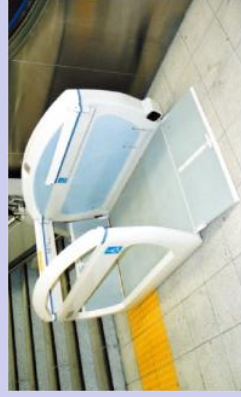
車椅子用階段昇降機