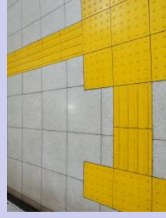
視覚障害者誘導用ブロック