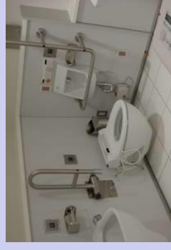
障害者対応型トイレ